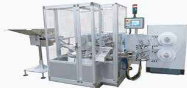
CMY 55 PA cadence jusqu'à 450 ppm

Enveloppeuse de bonbons durs en stylec "Open Point"